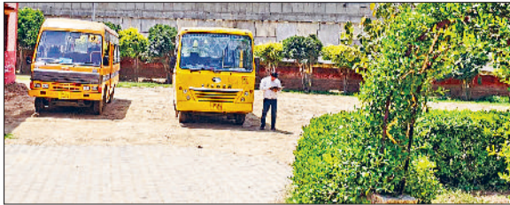
जीद। स्कूली बसों की जांच करते हुए अधिकारी।