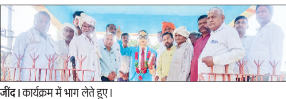
जीद। कार्यक्रम में भाग लेते हुए।