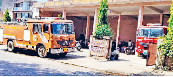
जीद। दमकल विभाग में खड़ी गाड़ियां।

चार जीद शहर में है। पहले दमकल विभाग के पास 17 गाड़ियां थी लेकिन पांच गाड़ियों के दस साल पूरे होने पर उन्हें नॉन एनसीआर परिया में भेज दिया गया है। एक अप्रैल से अब तक दमकल विभाग के पास आगजनी की 65 कॉल आ चुकी हैं। जिले की आबादी को देखते हुए दमकल विभाग के पास गाड़ियों की कमी है। इसके चलते स्थानीय अधिकारियों ने मुख्यालय के पास आठ गाड़ियां की डिमांड भेज रखी है। वहीं विभाग में इस समय 117 कर्मचारी कार्यरत हैं। जिसमें से 11