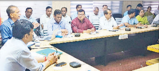
जीद। बैठक में भाग लेते हुए स्वास्थ्य अधिकारी।