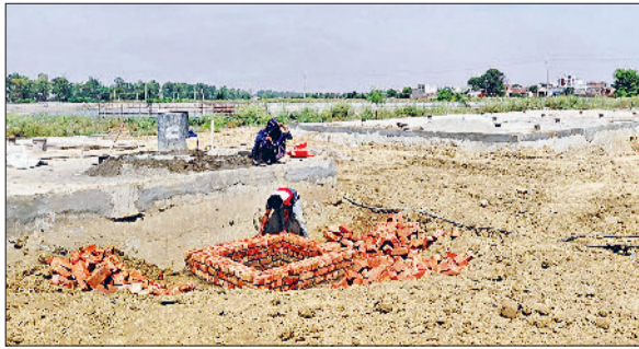
उचाना। उचाना कलां जलघर 2 में बन कर तैयार हुए टैंक।

उचाना कलां, उचाना शहर के लोगों के लिए अच्छी खबर है कि अब गर्मी के मौसम में उन्हें पीने के पानी की किसी तरह से परेशानी का सामना नहीं करना पड़ेगा। उचाना कलां के भौमरा रोड पर जो जनस्वास्थ्य विभाग का जलघर है वहां पर 45 लाख रुपये की राशि खर्च करके दो क्लीयर वाटर (साफ पानी) टैंक बनाए गए हैं। यहां पर पहले एक टैंक था, जिसमें पानी फिल्टर होकर स्टोर