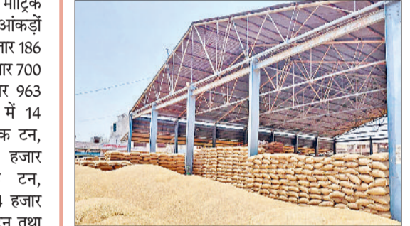
उठान। गेहूं की आवक निरंतर जारी है। अबतक 1128934 विंटल की आवक हो चुकी है। 615111 विंटल की खरीद विभिन्न एजेंसियों द्वारा की जा चुकी है। मार्केट कमेटी में दर्ज आंकड़ों के अनुसार प्रिंसिपल यार्ड ओजीएम में एचडब्ल्यूसी द्वारा 97255, हैफेड द्वारा 107597, प्रिंसिपल यार्ड उचाना में एचडब्ल्यूसी द्वारा 79451, हैफेड ने 155886 विंटल गेहूं की खरीद की है। सब यार्ड छातर में डीएफएससी ने 51049, हैफेड ने 43687 विंटल की खरीद की है। घोघडिया परचेज सेंटर पर डीएफएससी ने 50658 विंटल, काबच्छा परचेज सेंटर पर एचडब्ल्यूसी 23527 विंटल धनखड़ी परचेज सेंटर पर डीएफएससी ने 6001 विंटल की खरीद की है। अब तक प्रिंसिपल यार्ड सब यार्ड एवं परचेज सेंटरों पर 1128934 विंटल गेहूं की आवक हो चुकी है। 615111 गेट पास अब तक कट चुके हैं। प्रिंसिपल यार्ड ओजीएम में 3312, प्रिंसिपल यार्ड उचाना में 6648, सब यार्ड छातर में 1714, परचेज सेंटर घोघडिया में 2672, काबच्छा में 1458, धनखड़ी में 174 गेट पास कट चुके हैं। 14155 गेट पास में से 11925 गेट पास बायोमेट्रिक हो चुके हैं। मार्केट कमेटी सॉलिव योगेश ने कहा कि किसी तरह की परेशानी खरीद को लेकर किसान आदतियों को नहीं आने दी जा रही है।

हैफेड द्वारा एक लाख एक हजार 521 मीट्रिक टन तथा हरियाणा वेयर हाउस कॉरपोरेशन द्वारा 66 हजार 417 मीट्रिक टन गेहूं खरीदा गया है। मंडी वार आंकड़ों के अनुसार उचाना मंडी में 44 हजार 186 मीट्रिक टन, पिल्लुखेड़ा में 17 हजार 700 मीट्रिक टन, जीद में 42 हजार 963 मीट्रिक टन, अलेवा में 14 हजार 637 मीट्रिक टन, सफीदों में 11 हजार 241 मीट्रिक टन, जुलाना में 24 हजार 974 मीट्रिक टन तथा नरवाना में 25 हजार 904 मीट्रिक टन गेहूं की खरीद की गई है। उन्होंने बताया कि अब तक विभिन्न खरीद एजेंसियों द्वारा 17 हजार 872 मीट्रिक टन गेहूं की लिफ्टिंग की जा चुकी है। जिसमें खाद्य एवं आपूर्ति विभाग द्वारा 3 हजार 172 मीट्रिक टन हैफेड द्वारा 10 हजार 592 मीट्रिक टन, हरियाणा वेयर हाउस द्वारा 4 हजार 105 मीट्रिक टन गेहूं का उठान करवाया गया है। उपायुक्त ने गेहूं कटाई का सीजन पूरी जोरों पर है। इसलिए किसान गेहूं कटाई के उपरांत फसल अवशेषों को आग लगा देते हैं। इसलिए उन्होंने किसानों से अपील है कि वे पुसल अवशेषों को न जलाएँ बल्कि इनका सदुपयोग कर भूमि की उर्वरा शक्ति को बढ़ाएँ। उन्होंने किसानों का आह्वान किया कि वे अपने फसल अवशेषों में आग न लगाएँ बल्कि उन्हें खेत की मिट्टी में ही मिला दें।