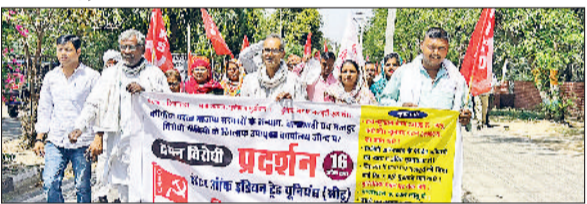
हरिभूमि न्यूज ॥ जीद