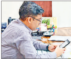
जीद। स्वगणना कर की डिजिटल जनगणना की शुरुआत करती डीसी।