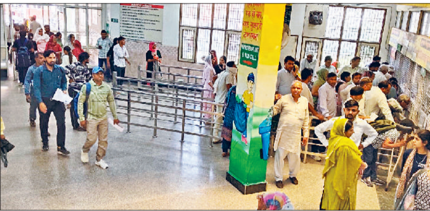
जीद। नागरिक अस्पताल में लगी लाइन।

वहीं दूसरी ओर गर्मी बढ़ते ही अस्पताल में मरीजों की संख्या में भी इजाफा हुआ है। बदलते मौसम की वजह से बुखार, जुखाम, खांसी एवं अन्य बीमारियों से पीड़ित लोग अस्पताल पहुंच रहे हैं।